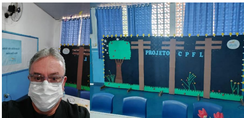
Evento em escola do município de Sumaré