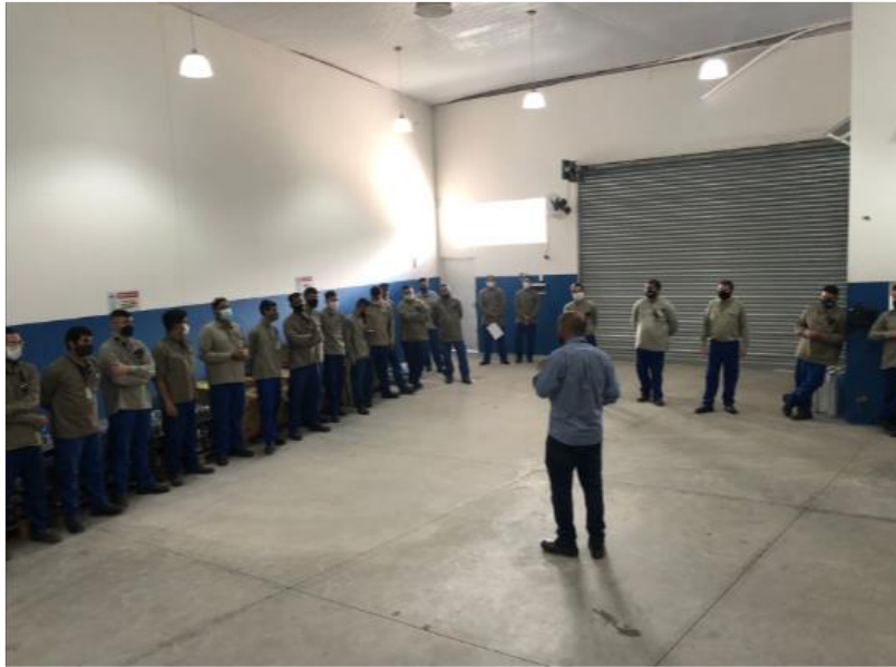
Realizada reunião com as equipes da contratada