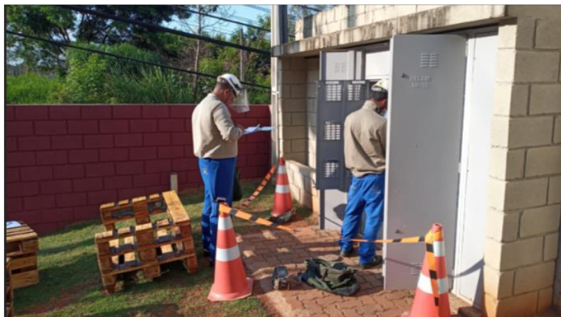
Efetuada acompanhamento de campo checando o processo de identificação e abordagem ao cliente