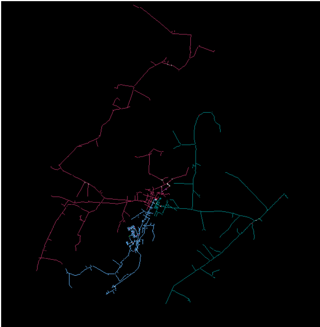
FIGURA 9 - SE MACATUBA 1 – UNIFILAR GEOELÉTRICO DA REDE PRIMÁRIA DE DISTRIBUIÇÃO (ALIMENTADORES)