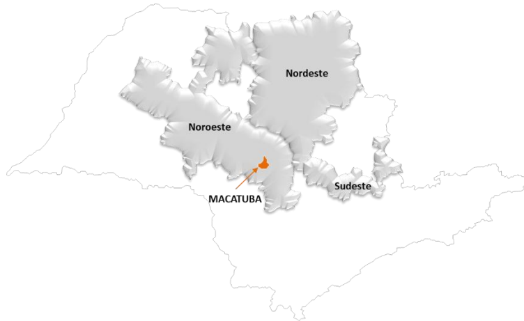
FIGURA 1- ÁREA DE CONCESSÃO DA CPFL PAULISTA INDICANDO SUAS TRÊS REGIÕES, DESTACANDO O MUNICÍPIO DE MACATUBA.

A região elétrica afetada correspondem à subestação Macatuba 1 (SE MTU). Os mapas a seguir identificam geograficamente a Área de Concessão da CPFL Paulista, a região afetada, o diagrama unifilar dessa subestação e, a configuração geoeétrica dos alimentadores (rede primária de distribuição de energia) partindo de cada subestação.